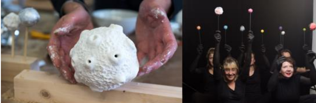
Beeld van de making-of: props en choreografie.

NEMO Science Museum is het grootste wetenschapsmuseum van Nederland en qua bezoekersaantallen het vijfde museum in het land. NEMO maakt kennis voor een breed publiek toegankelijk en brengt wetenschap dichtbij. KesselsKramer is een onafhankelijk Nederlands communicatiebureau gevestigd in Amsterdam, Londen en Los Angeles. KesselsKramer ontwikkelt multi-disciplinaire campagnes voor diverse opdrachtgevers in binnen- en buitenland.