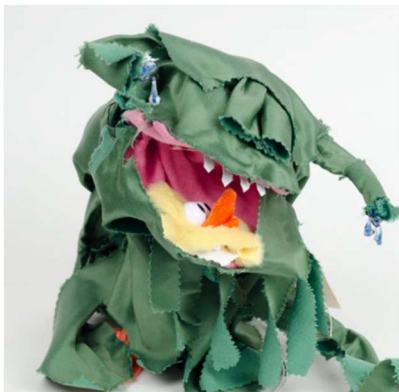
“Franken toy”: Verwerk elementen uit verschillende soorten speelgoed