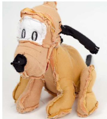
“Inside Out”: Keer de huid om en naai opnieuw