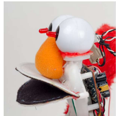
Elementen desolderen om ze opnieuw aan een nieuw circuit (en speelgoed) te bevestigen