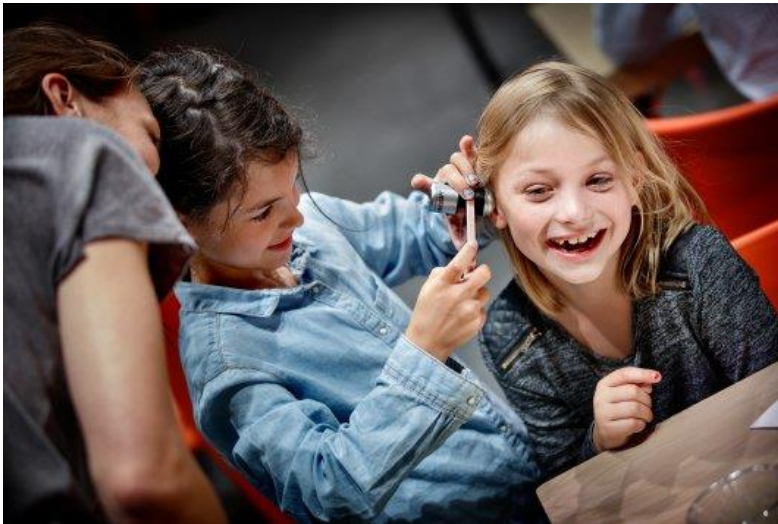
Shoptestdag in NEMO.

Een kinderpanel heeft voor NEMO Science Museum het leukste speelgoed voor de feestdagen beoordeeld. Tijdens een testmiddag ging het expertpanel met kinderen tussen de 8 en 12 jaar aan de slag met experimenten, gadgets, spellen en puzzels. Uit de verzamelde testresultaten vormen het familiespel 'Potion explosion', de telefoonmicroscop 'Phonescope' en het elektrisch bordspel 'Circuit Maze' de top drie.